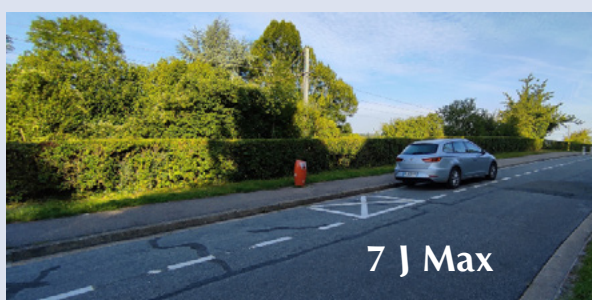
Chemin des Hamards

Sachez aussi qu'une dizaine de places est généralement disponible Chemin des Hamards (en face de l'école). Ces places sont aisément accessibles par le passage sous terrain. Nous incitons donc les personnes qui le peuvent à utiliser celles-ci afin de libérer le stationnement pour nos commerçants.